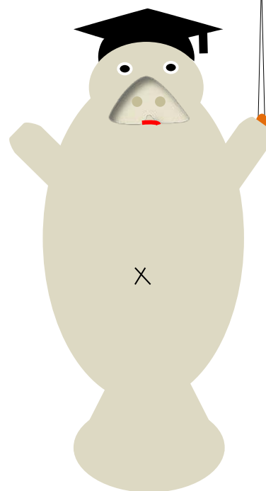
マナティーチャー