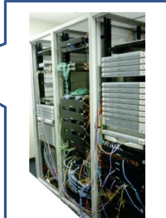
サーバ、スイッチ、試験器等の検証機器を保有