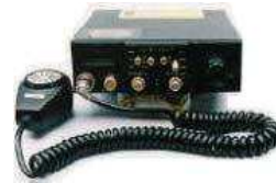
不法市民ラジオ送受信機