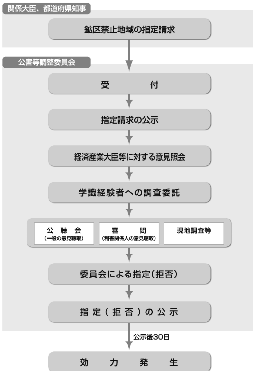
図 2 - 1 - 1 鉱区禁止地域の指定制度