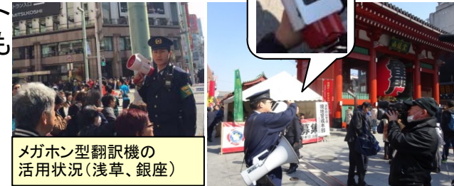
メガホン型翻訳機の活用状況(浅草、銀座)