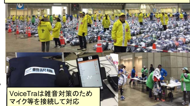
VoiceTraは雑音対策のためマイク等を接続して対応