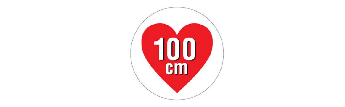
図2 据置きタイプRFID機器（高出力型950MHz帯パッシブタグシステム）用ステッカー

注1： ここでは、公共施設や商業区域などの一般環境下で使用されるRFID機器を対象としており、工場内など一般人が入ることができない管理区域でのみ使用されるRFID機器（管理区域専用RFID機器）については対象外としている。なお、管理区域専用RFID機器については、（一社）日本自動認識システム協会において、一般環境への流出を防止するため、取扱説明書等に注意書きを記載するとともに、管理区域専用RFID機器用ステッカー（図3）を貼付することとされている。