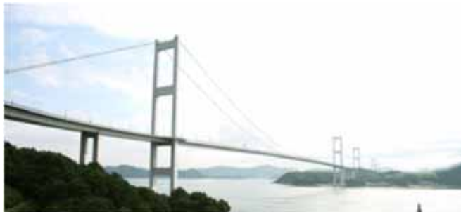
しまなみ海道