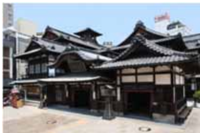
道後温泉本館

このため、四国運輸局及び四国地方整備局に対し、必要な改善措置を講ずるよう通知しました。