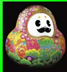
石川県観光 PR マスコットキャラクター 「ひやくまんさん」

「輪島塗」のお髭や「金箔」の体、「九谷焼」の色彩などの伝統工芸や、「石川門」「ことじ灯籠」などの景勝地が全身に描かれ、石川の魅力をギュッと凝縮したデザインのマスコットキャラクターです。