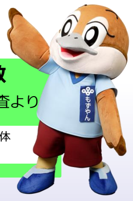
大阪府広報担当副知事 もずやん

自宅外通勤・通学者数 [自転車] 平成22年国勢調査より ※ ( ) 内は、自宅外通勤・通学者全体に占める自転車利用者の割合