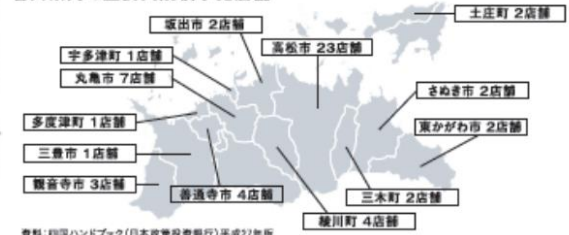
香川県内の主要大規模小売店舗