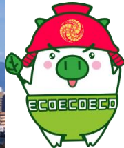
福岡県 広報部長 エコトン