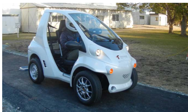
図 3 電気自動車のバッテリーレス走行に世界で初めて成功

http://www.soumu.go.jp/soutsu/tokai/mymedia/28/0328.html