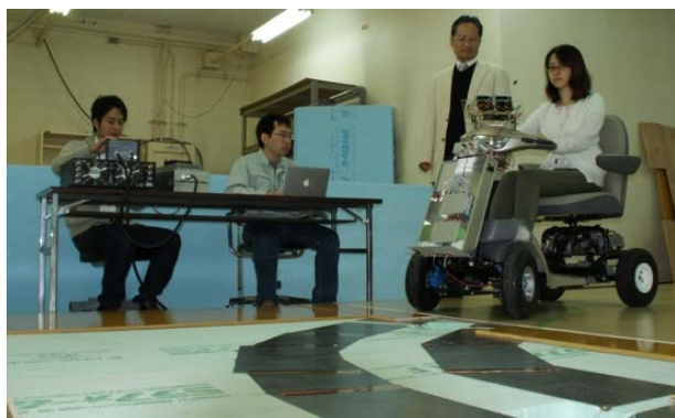
図 2 大学内実験室に敷設した電化フロア上をバッテリーレスで走行する電動カート

本研究開発でタイヤ集電方式による EVER システムのフィービリティを明示した。初年度はタイヤ集電方式による電化フロアからの給電のみで 0.8m の電動カート有人走行に成功した。次年度は電動カートの長距離連続走行および曲線路と交差路を含む 8 の字型コースの連続走行を達成した。最終年度は屋外アスファルト舗装電化道路における超小型電気自動車への連続・高速走行中給電およびモルタル舗装電化フロアにおける電動カートへの連続走行中給電を達成した。以上の 3 年間の研究成果でタイヤ集電方式による走行中給電の実現性を示せた。