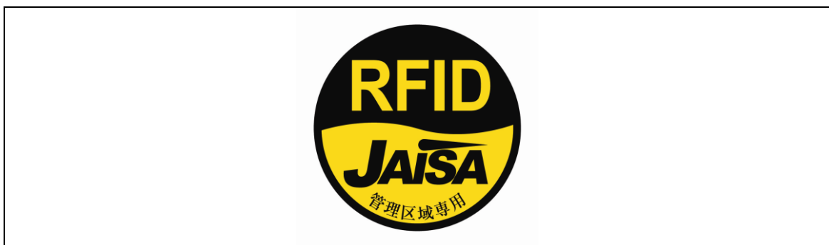
図3 管理区域専用RFID機器用ステッカ

注1： ここでは、公共施設や商業区域などの一般環境下で使用されるRFID機器を対象としており、工場内など一般人が入ることができない管理区域でのみ使用されるRFID機器（管理区域専用RFID機器）については対象外としている。なお、管理区域専用RFID機器については、（一社）日本自動認識システム協会において、一般環境への流出を防止するため、取扱説明書等に注意書きを記載するとともに、管理区域専用RFID機器用ステッカ（図3）を貼付することとされている。