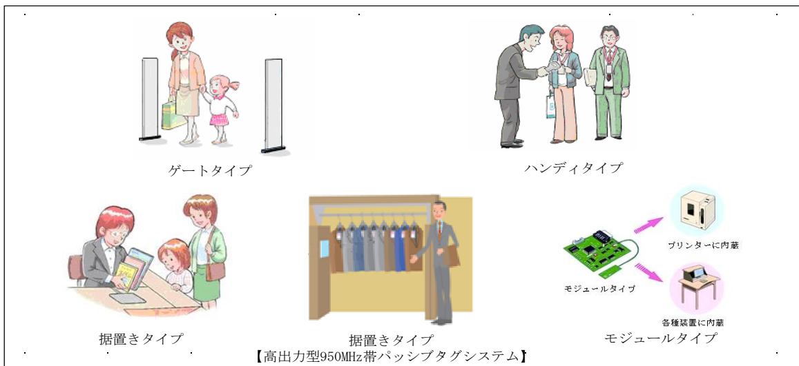
図4 各タイプのRFID機器

注3： 比較的長距離の通信が可能なUHF帯（950MHz帯）の電波を利用するRFID機器。 例えば、コンテナやパレットなどに貼付したタグの一括読み取り等のアプリケーションに使用されることが想定される。