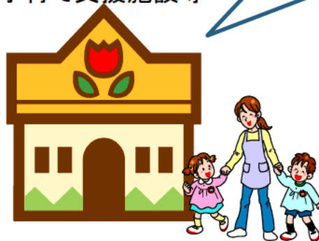
子育て支援施設等