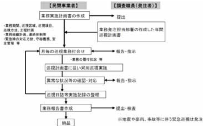
従来の実施フロー図