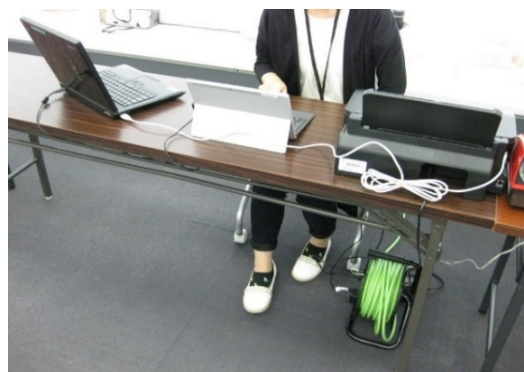
機器の設置の様子