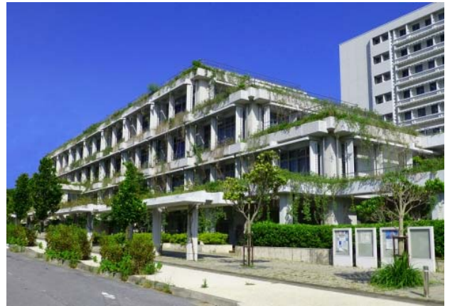
な はだい ちほうごうどうちようしゃ ごうかん 那覇第2地方合同庁舎1号館