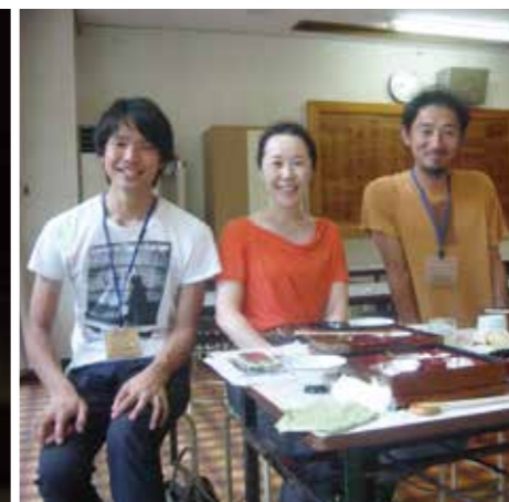
岐阜県山県市で集落支援に携わる若者と