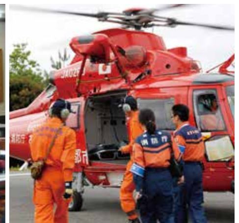
伊勢・志摩サミット消防特別警戒結団式にて