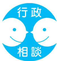
行政相談シンボルマーク

また、行政相談委員全体会議に引き続いて開催される群馬行政相談委員協 議会総会において、行政相談委員活動に関し顕著な功績のあった 委員 1 名 と、行政相談委員活動の啓発・宣伝に大きく貢献していただいた 上毛新聞社 及び群馬テレビ株式会社に全国行政相談委員連合協議会会長表彰 が贈られ ます。