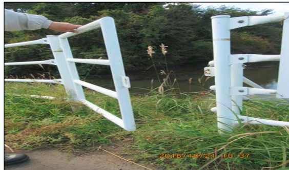
【事例3】安全柵の扉が施錠されていない(13事例)