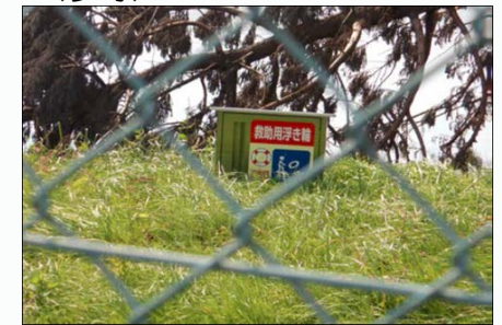
＜救助用浮輪が設置されている他のため池＞