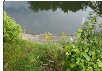
＜赤丸の箇所を道路から撮影＞