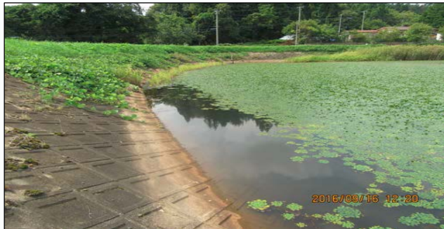
【事例1】安全柵が設置されていない(30事例)