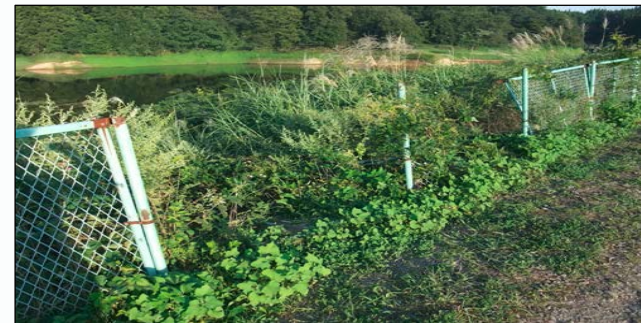
【事例2】安全柵に破損箇所や隙間がある(21事例)