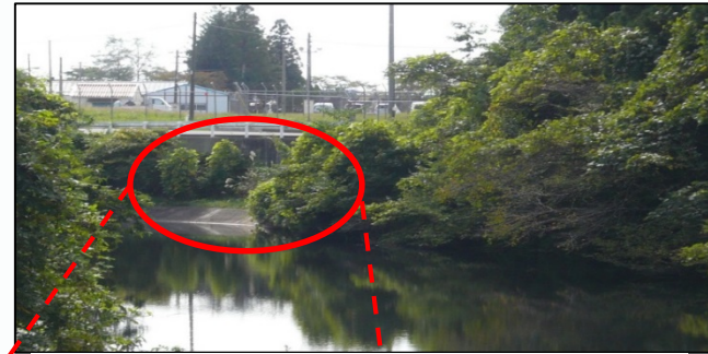
＜赤丸の箇所転落死亡事故が発生＞