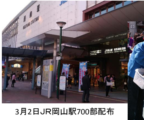
3月2日JR岡山駅700部配布

☞ スマホのルールづくりなどを声かけしながら通行人へ配布。広島駅ではテレビ局から取材！