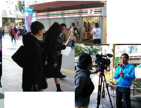
3月17日JR広島駅1000部配布