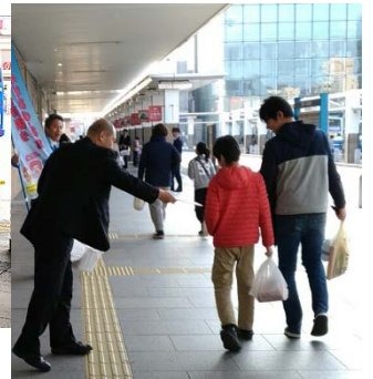
3月28日JR松江駅400部配布