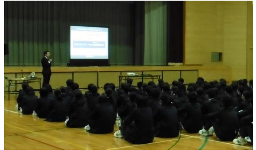
KDDIと連携し、広島市立早稲田中学校で啓発活動(4月24日)

これらの取組は、中国総合通信局が管内各県及び政令市の教育関係機関、PTA団体、私学団体、警察本部及び携帯電話事業者等と連携した「スマートフォン時代に対応した青少年のインターネット利用に関する中国連絡会」(略称:スマホ連絡会)の活動の一環として取り組んだものです。各取組においてご理解、ご協力を賜り厚くお礼申し上げます。