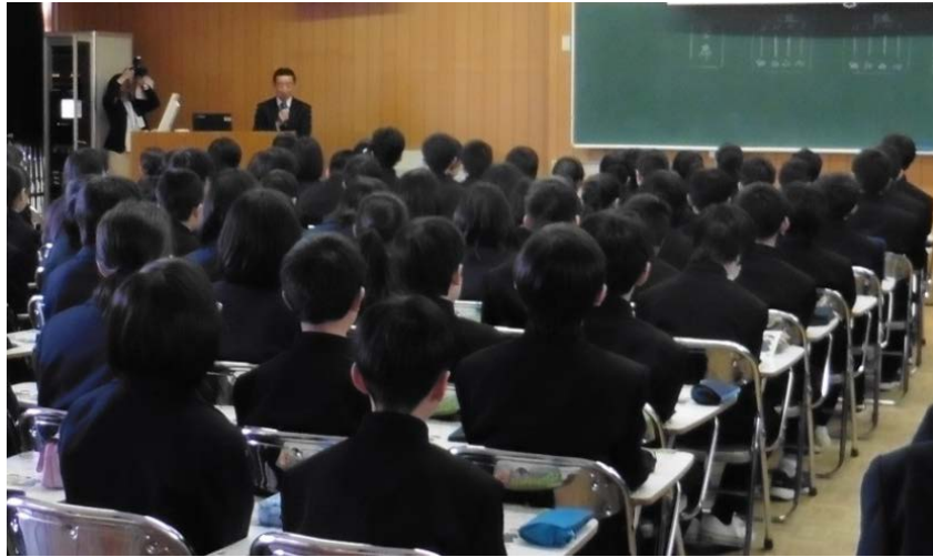
NTTドコモと連携し、広島大学付属中学校・高等学校で啓発活動(4月12日)

☞NTTドコモ中国支社及びKDDI中国総支社と連携して、生徒に対して啓発活動を実施、皆さん真剣！