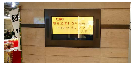
広島市デジタルサイネージ(地下街シャレオ)