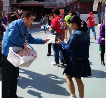
3月12日マツダスタジアム1000部配布