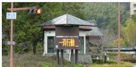
山口県インフォメーションシステム