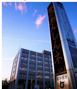
鳥取県庁電光掲示板