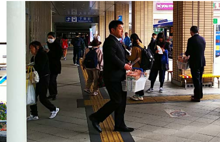
3月23日JR下関駅300部配布