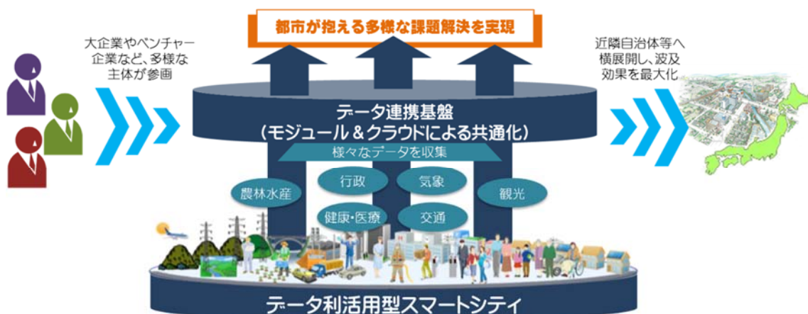
図1 データ利活用型スマートシティのイメージ

データ利活用型のスマートシティは、従来のハード中心の街づくりとは異なり、短いサイクルでバージョンアップを行うことが可能であり、PDCA（Plan Do Check Action）を回すことや技術革新の成果を導入することにより高い発展性を期待できるものでなければならない。こうした状況を踏まえ、ICT街づくりの成功例の横展開の取組に加え、データ利活用型のスマートシティの取組を同時並行で推進するための課題や対応の方向性を総合的に整理することが必要である。