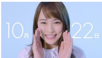
(投票日告知ムービー)