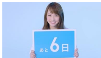
(投票日カウントダウンムービー)