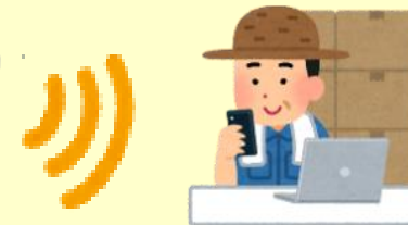
スマートフォン パソコン