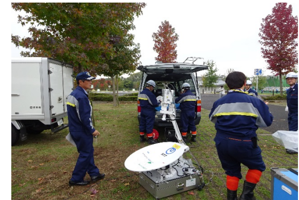
平成28年度の訓練模様