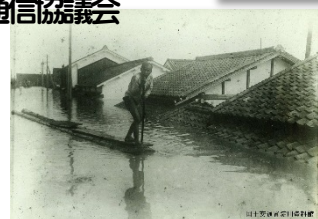
高槻町本町筋の濁水