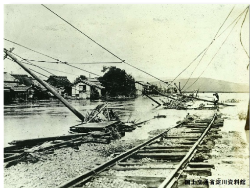
牧野村(現枚方市)の惨状

災害時にはSNS上に有用な情報からデマまで、様々な情報が膨大に流れます。正確な状況を把握するために、これらを整理し分かりやすく提供するシステムと、求める情報をピンポイントにかつ網羅的に得ることが出来るシステムを紹介します。