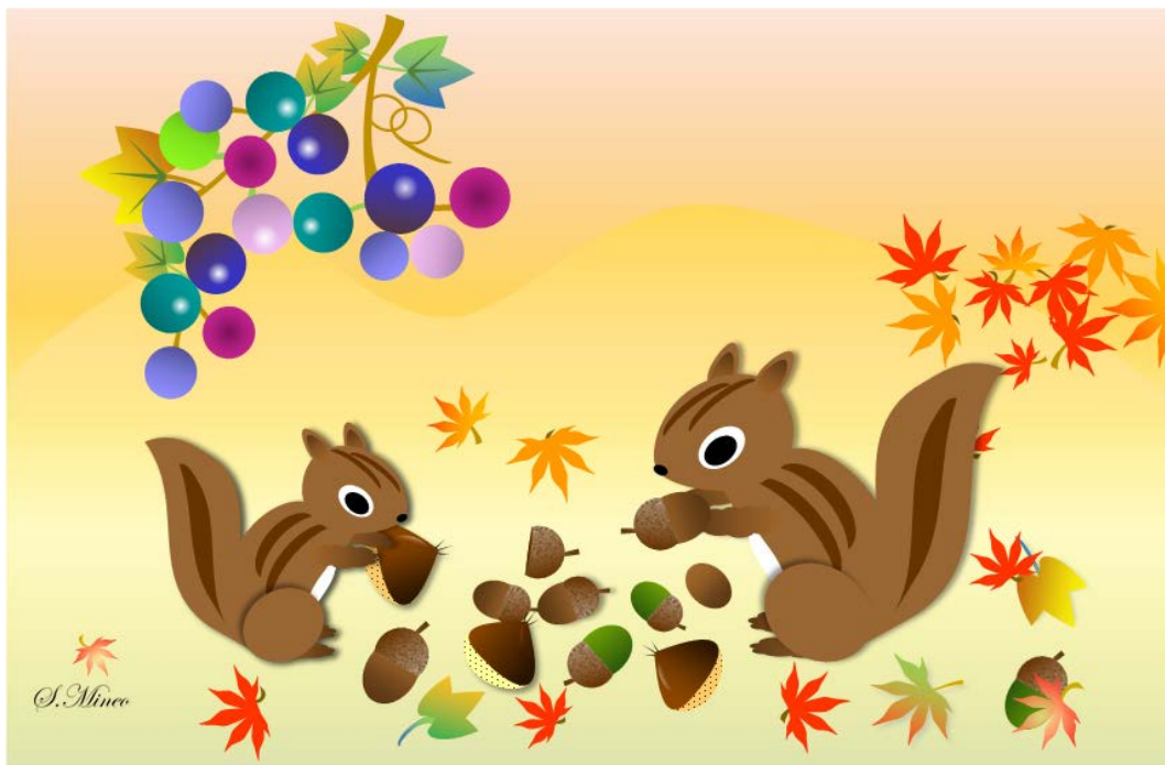
Wordの図形で描いたイラスト 作者 キママさん