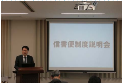
信書便制度説明会

また、平成29年11月9日、京都市内において、信書の送達サービスを利用する自治体関係者などを対象に信書便制度説明会を開催しました。