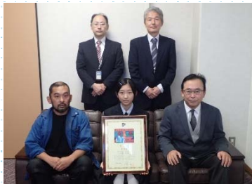
尼崎市立成良中学校の皆さま

また、受信環境クリーン中央協議会へは全国の229校から1,740作品の応募があり、10作品が入賞作品として選出されました。そのうち近畿地方からは、兵庫県加古川市立氷丘中学校2年生の1作品が日本民間放送連盟会長賞、同校の2作品が中央協議会会長賞を受賞しました。なお、表彰状等の交付は平成29年11月1日から13日にかけて入賞者の在籍する各中学校で行いました。