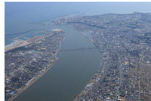
利根川河口