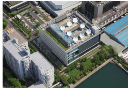
写真 スカパー東京メディアセンター(東京都江東区)