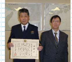
関西空港海上保安 航空基地