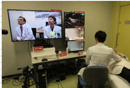
患者のエコー画像を伝送する様子 (右)川上診療所医師 (右上モニター)エコー画像 (左モニター)和歌山医大病院医師

初日の2月20日には報道機関向けのデモンストレーションが行われ、川上診療所の医師が患者のエコー映像や皮膚の映像を伝送し、和歌山医大病院の専門医がリアルタイムに伝送される高精細な映像から適確に症状を把握し、診療所医師や患者に助言する様子が紹介されました。