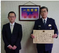
大阪府淀川警察署

今般、不法無線局の取締りを積極的に行い、多大の効果を上げ、電波利用秩序の維持に大きく貢献された10捜査機関に対して感謝状を贈呈いたしました。