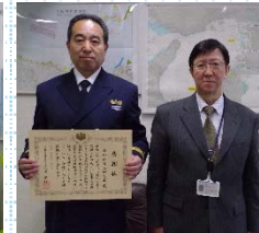
岸和田海上保安署