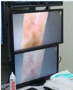
伝送された皮膚の疾患の映像 (上)5G映像、(下)従来映像