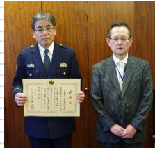
大阪府交野警察署