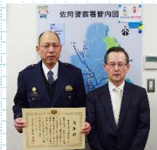
兵庫県佐用警察署