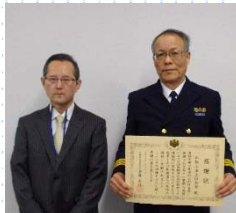
和歌山海上保安部