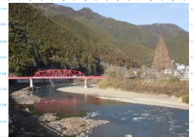
川上診療所のある日高川町