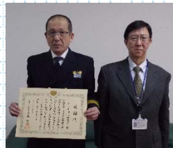
加古川海上保安署

近畿総合通信局は今後も捜査機関と連携し、快適で安心・安全な社会生活を支える良好な電波利用環境の維持及び整備に努めてまいります。