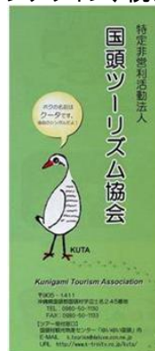
国頭の観光交流を考える会