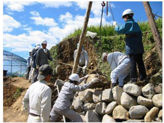
ボランティアによる棚田の石垣修復