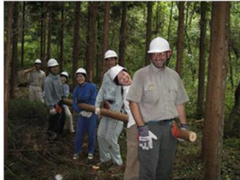
海外ボランティアも山仕事

都市と農山村が連携し、農山村の里山や地域を元気にしましょう。そのためには、都市からのボランティアをお客さん扱いするのではなく、一緒に汗を流し、成長することが大切だと思います。一緒に頑張りましょう！