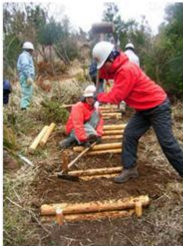
植林地での遊歩道整備

一過性のイベントではなく、地元の農家が楽しみながら実施できることを大切にしてきました。また、安全で楽しい活動を心がけ、活動リーダーの育成や安全管理に力をいれたことで、活動の質が徐々に向上し、結果としてリーダーやロコミの助けを得られたように思います。