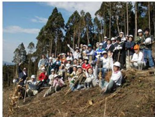
台風被害山林に広葉樹の植林