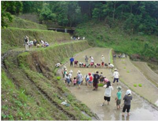
棚田での田植え風景