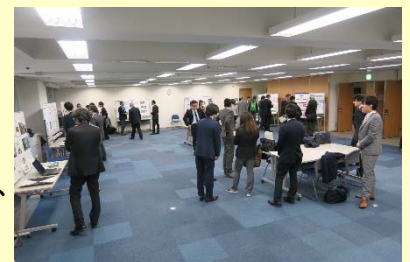
ポスターセッションの様

並行してポスターセッションも行われ、事例紹介の内容等について、発表者と参加者との間で情報交換も行われました。