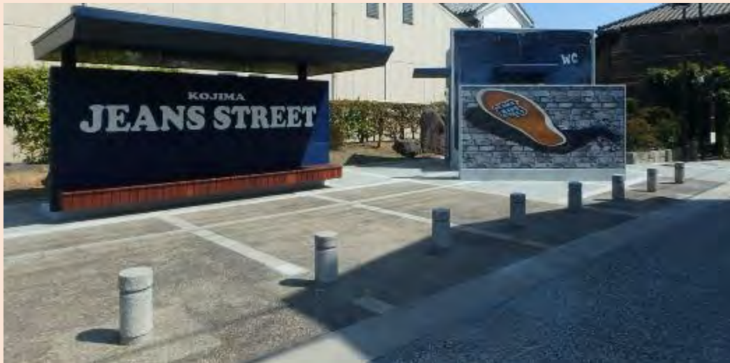
ジーンズストリート内の公園・トイレ (H30. 3)

国産ジーンズ発祥の地、児島地域では、空き店舗が増えた商店街をジーンズストリートとして再生。地域一体で個性と魅力の向上に取り組んでいる。