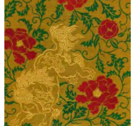
茶屋町 錦莞蕙(キンカン)