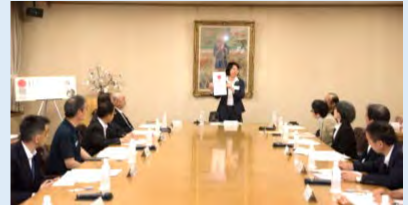
倉敷市日本遺産推進協議会

平成29年6月 市、郵便局、歴史文化や経済・観光の関係団体、公共交通機関や市議会等の代表で構成する「 倉敷市日本遺産推進協議会 」を設立。日本遺産を生かした地域の魅力向上と活力創出の取組を進めている