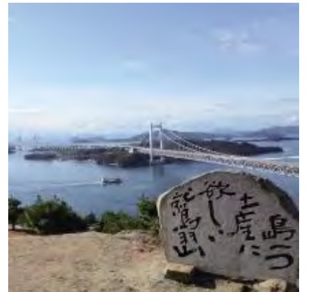
児島 鷺羽山と瀬戸大橋