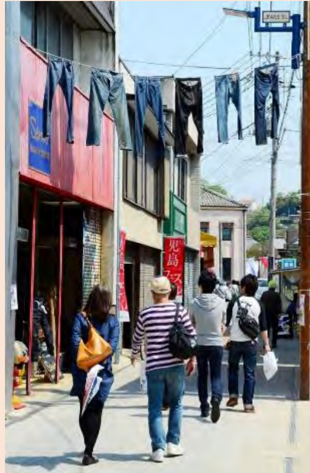
ジーンズストリート