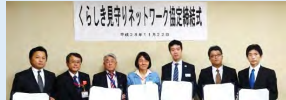
くらしき見守りネットワーク協定締結式