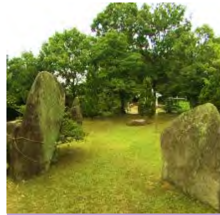
庄 楯築(タツキ)遺跡