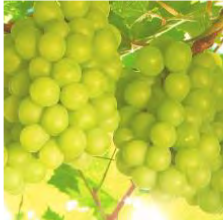
船穂 マスカット・オブ・アレキサンドリア