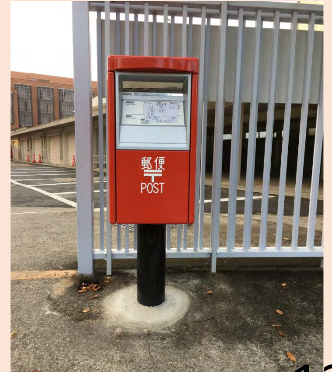
児島地区のポスト