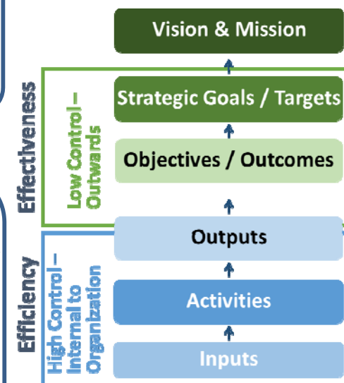
図: 戦略計画のフレームワーク