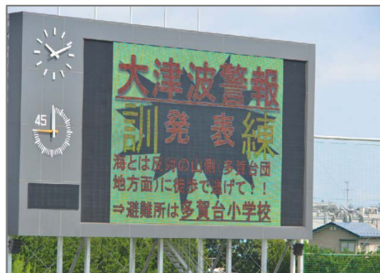
【写真②】 大型スクリーンの表示