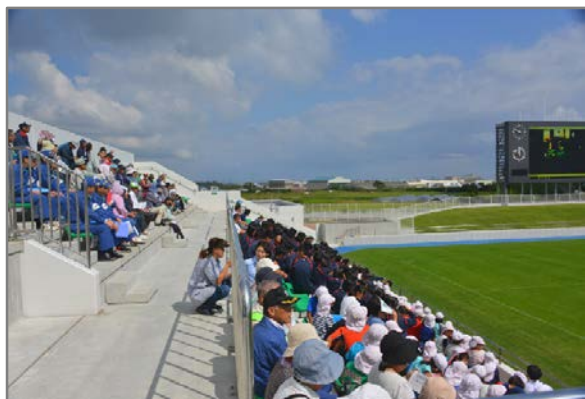
【写真①】 地域住民等が参加