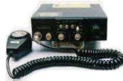
不法市民ラジオ送受信機