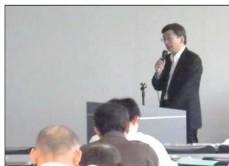
(弁護士による具体的事例の報告)