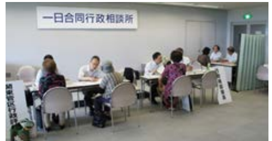
一日合同行政相談所開設の様子