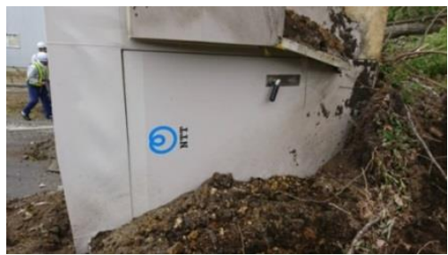
土砂崩れによる通信ビル倒壊