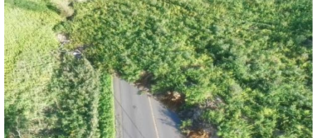
土砂崩れによるケーブル被災