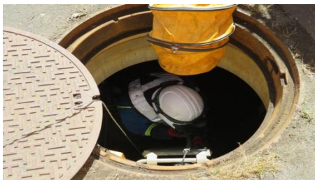
マンホールでの復旧作業