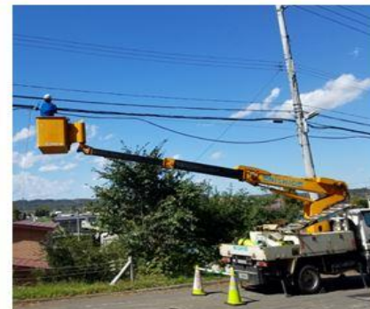
迂回ルートへのケーブル敷設