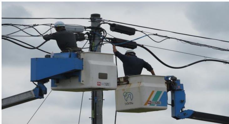
ケーブル復旧作業