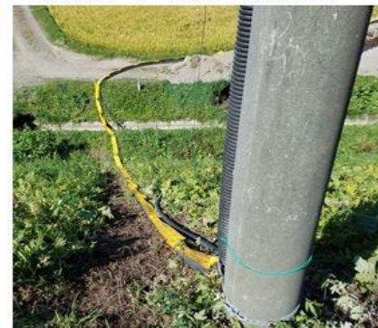
土砂崩れ区間の暫定ケーブル敷設