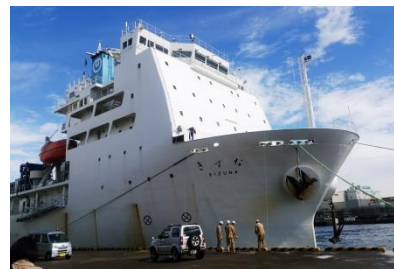
《NTT WE MARINE所有の「きずな」》