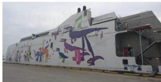
《防衛省チャーターの「なっちゃんWorld」》