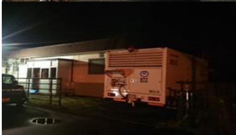
移動電源車による通信ビルへの給電