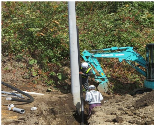
土砂崩れエリアでの電柱建柱作業