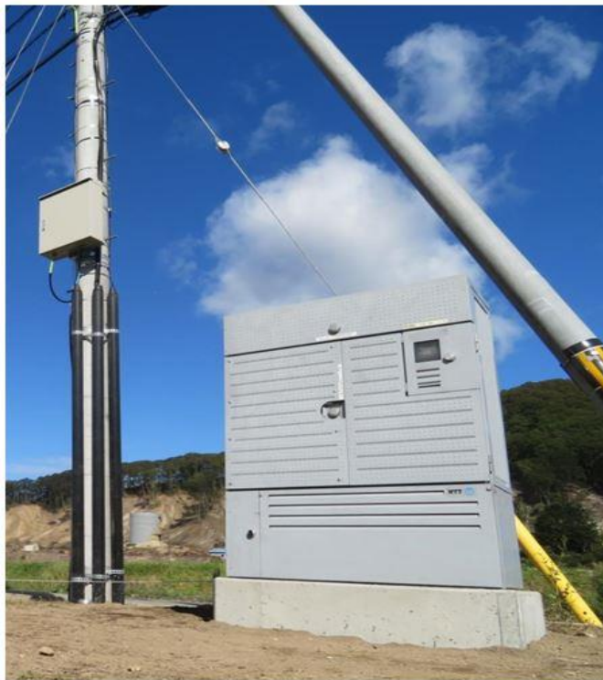
暫定復旧として設置した通信設備