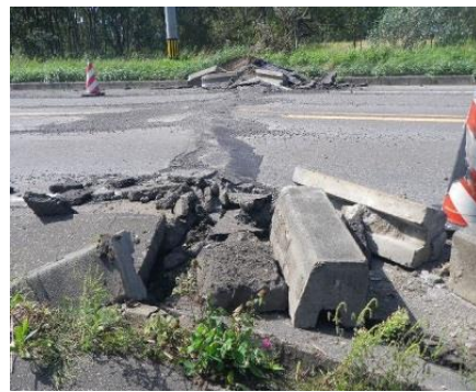
地割れによる地下設備被災