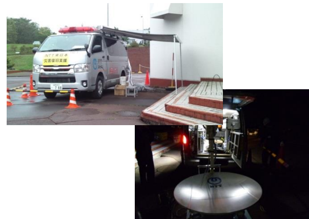
《ポータブル衛星車》