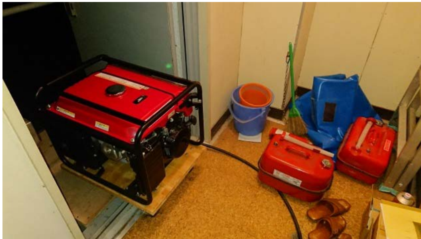
現地保管発電機によりバックアップ