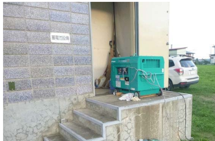
地元業者により発電機を持ち込み