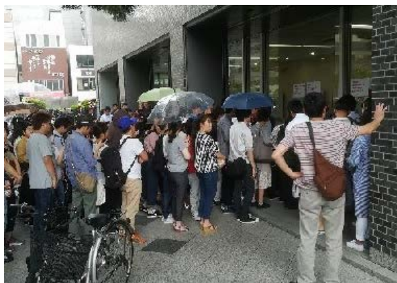
充電サービスの状況