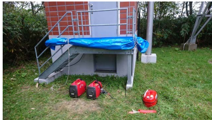
持ち込んだ発電機によりバックアップ