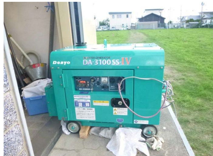
3. 1kVAディーセル発電機