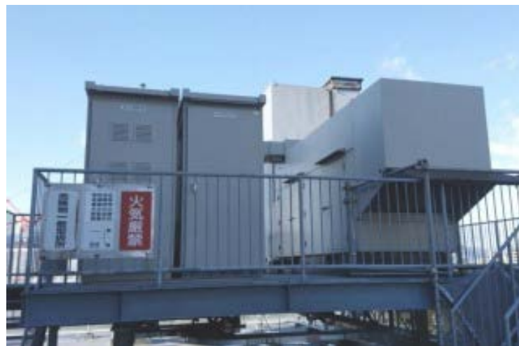
1500kVAガスタービン発電機

取引のある燃料会社においても、震災当日は停電によりポンプが稼働せず、翌日に給油。