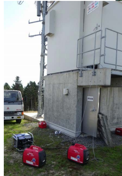
複数の発電機を使用