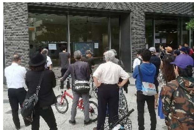
本社前に街頭テレビを設置