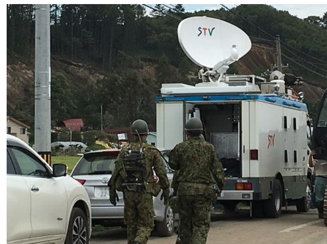
衛星中継車による伝送