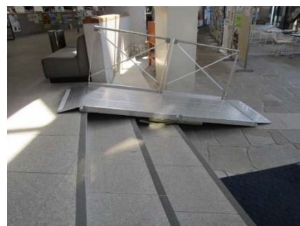
携帯スロープの設置