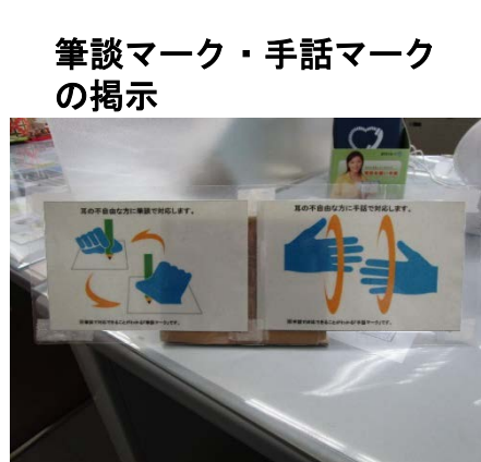
筆談マーク・手話マークの掲示