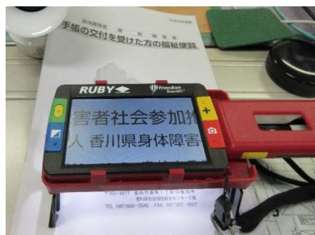
拡大読書器の設置