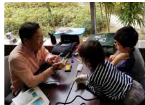
元放送局勤務の60代