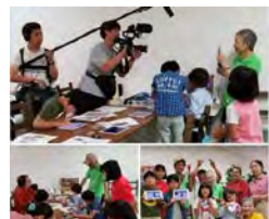
韓国KBSスペシャルで放送