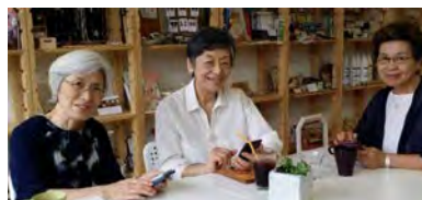
コミュニティカフェ