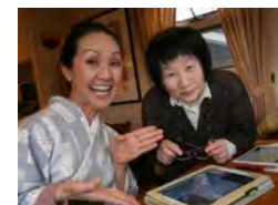
介護家庭に家庭訪問