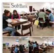
キャリアショップ