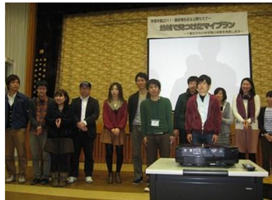
幸雲南塾第1期の最終発表会の様子