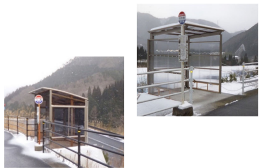
▲計4か所のバス停に待合所が設置され、雨風や雪を避けられるようになりました。