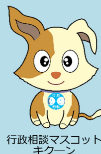
行政相談マスコット キクーン