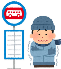
▲バス停に待合所を作してほしい！