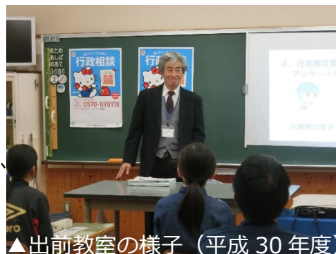
▲出前教室の様子（平成30年度）

当日は、通学路の危険箇所など、児童にとって身近な「行政に関する困りごと」の改善事例について、行政相談委員が説明します。