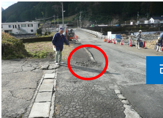
▲道路の凹凸になっていて危険！

これまで出前教室で受け付けた相談の中には、次のように改善に結びついたものもあります。