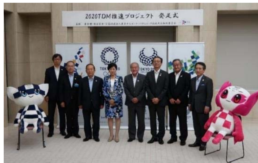
「2020TDM推進プロジェクト」発足式（2018/8/8）