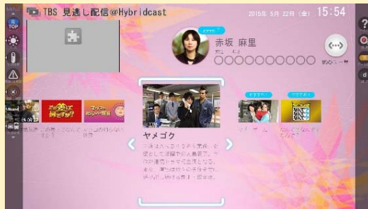
放送と連携した見逃し配信 (TBSテレビ様) 技研公開 2015