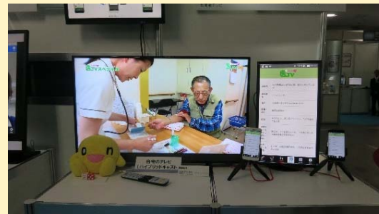
スマホとテレビによる地域医療との連携 (北海道テレビ様) 技研公開 2017