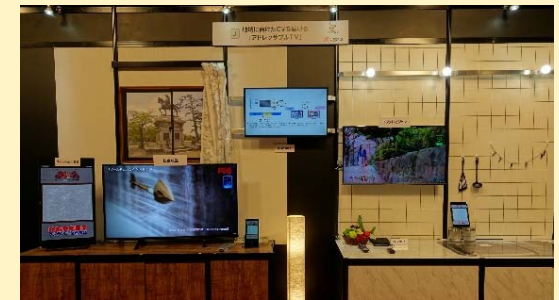
視聴者に応じたCM差し替え (フジテレビジョン様、仙台放送様) 技研公開 2018