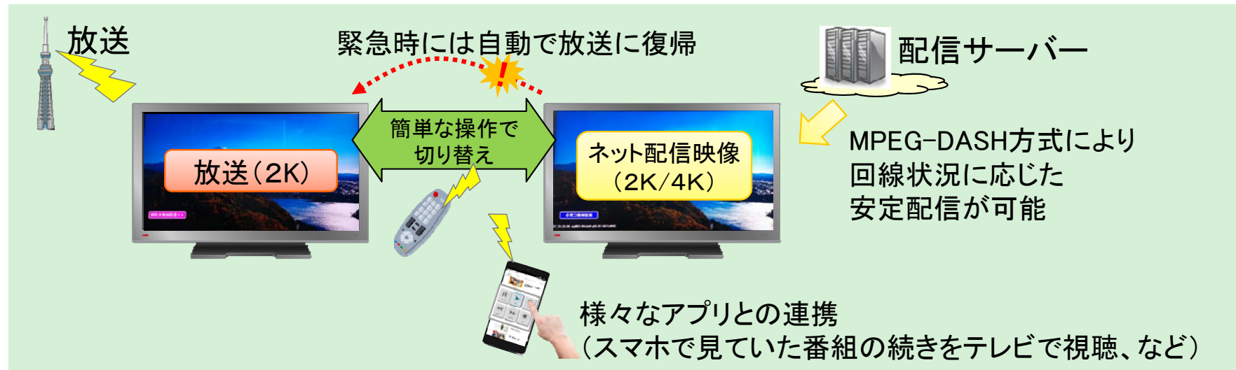
テレビ向け映像配信技術の概要