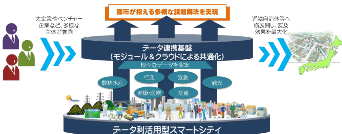
図1 データ利活用型スマートシティのイメージ

データ利活用型のスマートシティは、従来のハード中心の街づくりとは異なり、短いサイクルでバージョンアップを行うことが可能であり、PDCA（Plan Do Check Action）を回すことや技術革新の成果を導入することにより高い発展性を期待できるものでなければならない。こうした状況を踏まえ、ICT街づくりの成功例の横展開の取組に加え、データ利活用型のスマートシティの取組を同時並行で推進するための課題や対応の方向性を総合的に整理することが必要である。