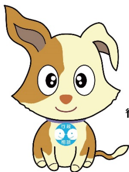
行政相談のマスコット キクーン